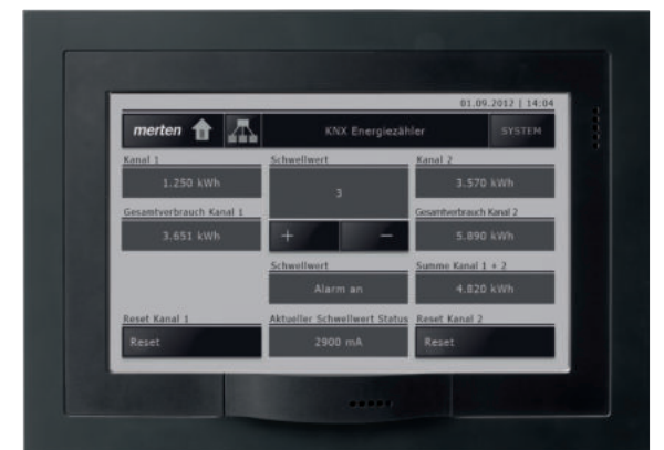
Präzise Energiedaten einfach übersichtlich aufbereitet.