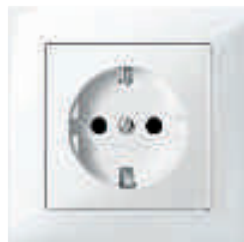
Steckdose, M-Pure aktivweiß