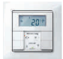
Taster 2fach plus mit Raumtemperaturregler, M-Pure aktivweiß