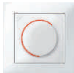
Drehdimmer, M-Pure aktivweiß