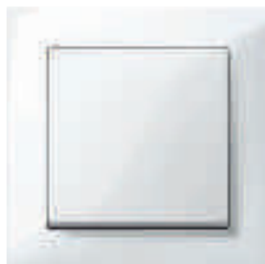
Taster, M-Pure aktivweiß